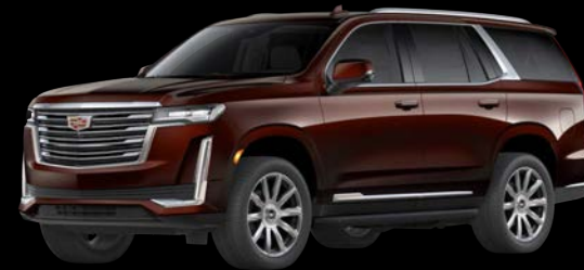
マホガニーメタリック