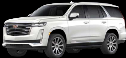
クリスタルホワイトトゥリコート