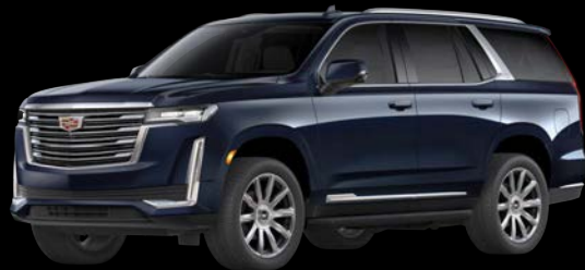
ダークムーンブルーメタリック