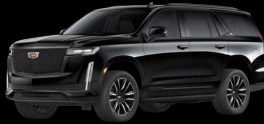
セーブルブラック