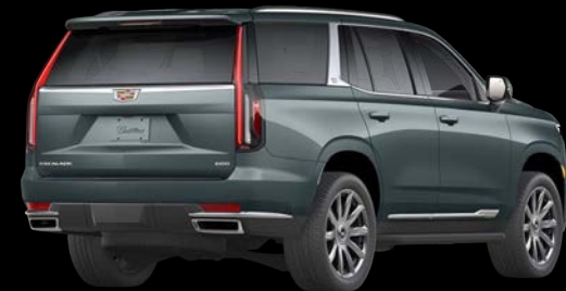
サイプレスメタリック