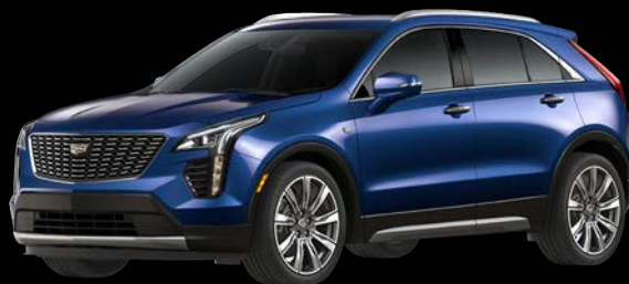
オコナスメタリック