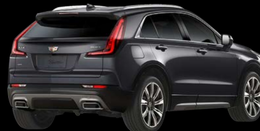
ギャラクティックグレーメタリック *