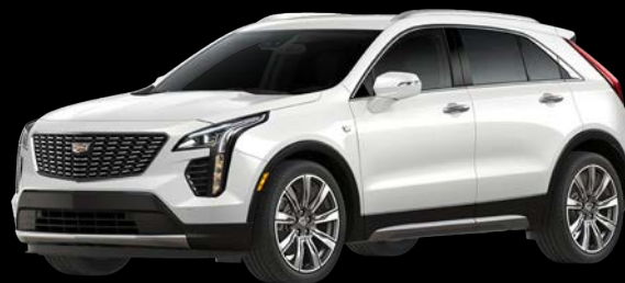
クリスタルホワイトトリコート *