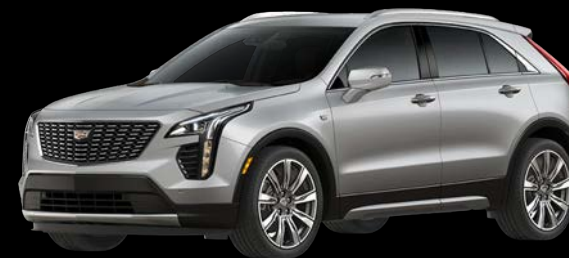
シャークスキンメタリック *