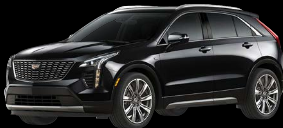
ステラーブラックメタリック *