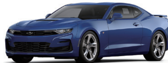
リバーサイドブルーメタリック