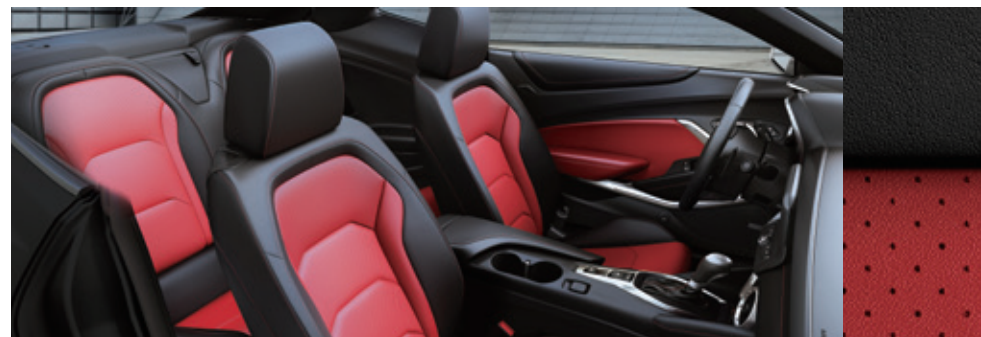
ジェットブラック/アドレナリンレッド