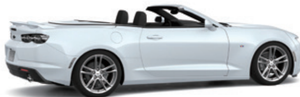
サミットホワイト