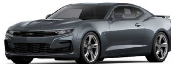
シャドウグレーメタリック