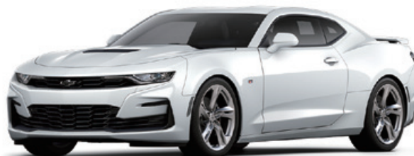
サミットホワイト