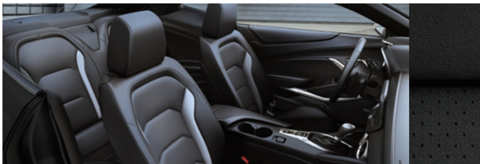
ジェットブラック/ジェットブラック