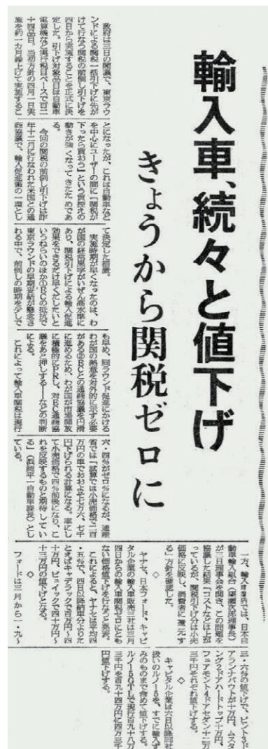
日刊自動車新聞、1978年3月4日付1面

日本政府は1月14日、輸入検査手続きにおける自動車の型式指定審査手続きを含む58事例について、改善措置をとることを発表した。運輸省も日本自動車輸入組合に加入するディーラーが取り扱う少数輸入車については、4月から並行輸入車並みに検査手続きを簡素化する