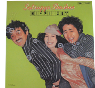
ハイファイセットのレコード

まず、8月には70周年記念に使用する「70年、いいものだけを世界から」というスローガンと、シンボルマー