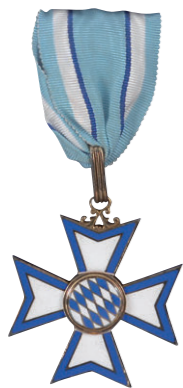
ドイツ連邦共和国バイエルン州功労勲章

授与式は同州の首都、ミュンヘン市の中心街にある迎賓館で行われ、荘厳な雰囲気の中でバイエルン州のシュトラウス首相から52名の受章者全員に金賞が授与され