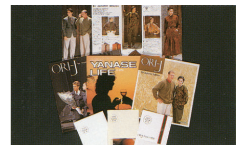
通信販売総合カタログ『ORI-J』