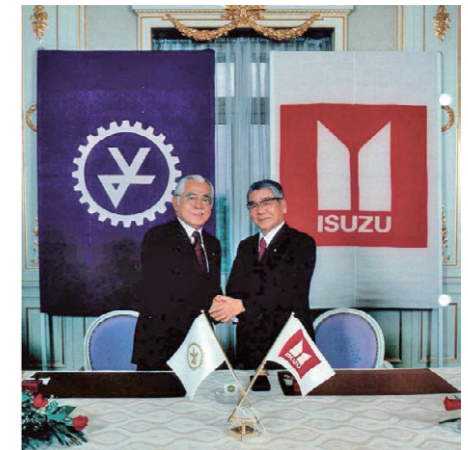
いすゞ自動車とピアッツァ・ネロの販売契約締結

その後、1990（平成2）年6月1日よりヤナセネット専売車種のPA-NEROを販売したほか、1991（平成3）年3月2日からスポーツモデルのPA-NERO イルムシャー160Rを、同年8月3日からニューピアッツァ・ネロを発売するなど、当社の業績に貢献した。しかし、いすゞ自動車が業績不振による再建計画で乗用車の開発と生産中止を決定したため、1993（平成5）年をもって提携を解消した。