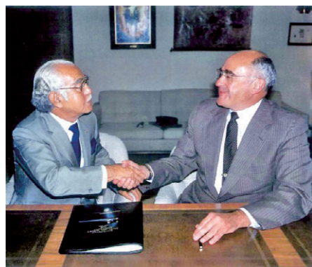
GM社との一手輸入販売契約を締結