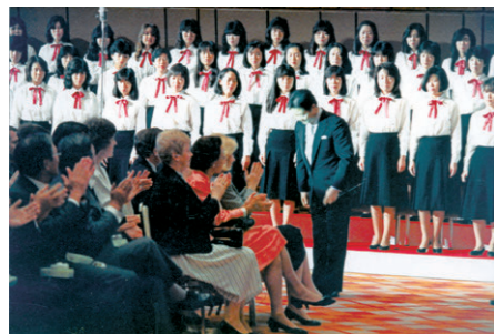
式典のフィナーレを飾ったヤナセ混声合唱団