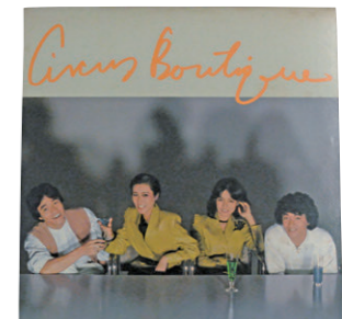
サーカスのレコード