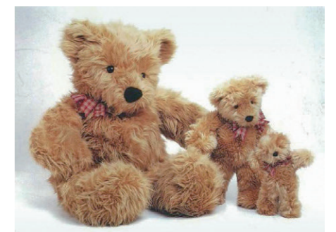
ノースアメリカンベア社製ぬいぐるみ「ラグルス」