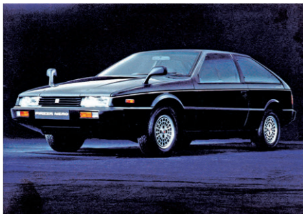
ピアッツァ・ネロ販売開始