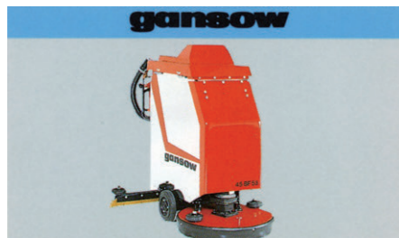
ガンソー自動床洗浄機