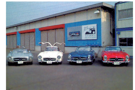
「オールドタイマーセンター」

ウエスタン自動車は、1993(平成5)年1月1日より、社名を株式会社ウエスタンコーポレーション、略称ウエスコに変更し、ヴィンテージカーの修理・レストア工場「オールドタイマーセンター」、輸入車業界初の本格的な用品専門店「Autohof WESCO」を開設するなど業態転換を図った。