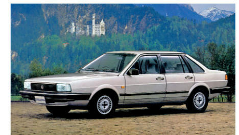
サンタナ販売開始