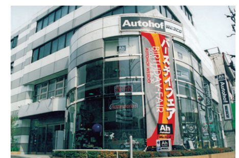
東京・世田谷にあったウエスコ直営のカーアクセサリショップ「Autohof WESCO」