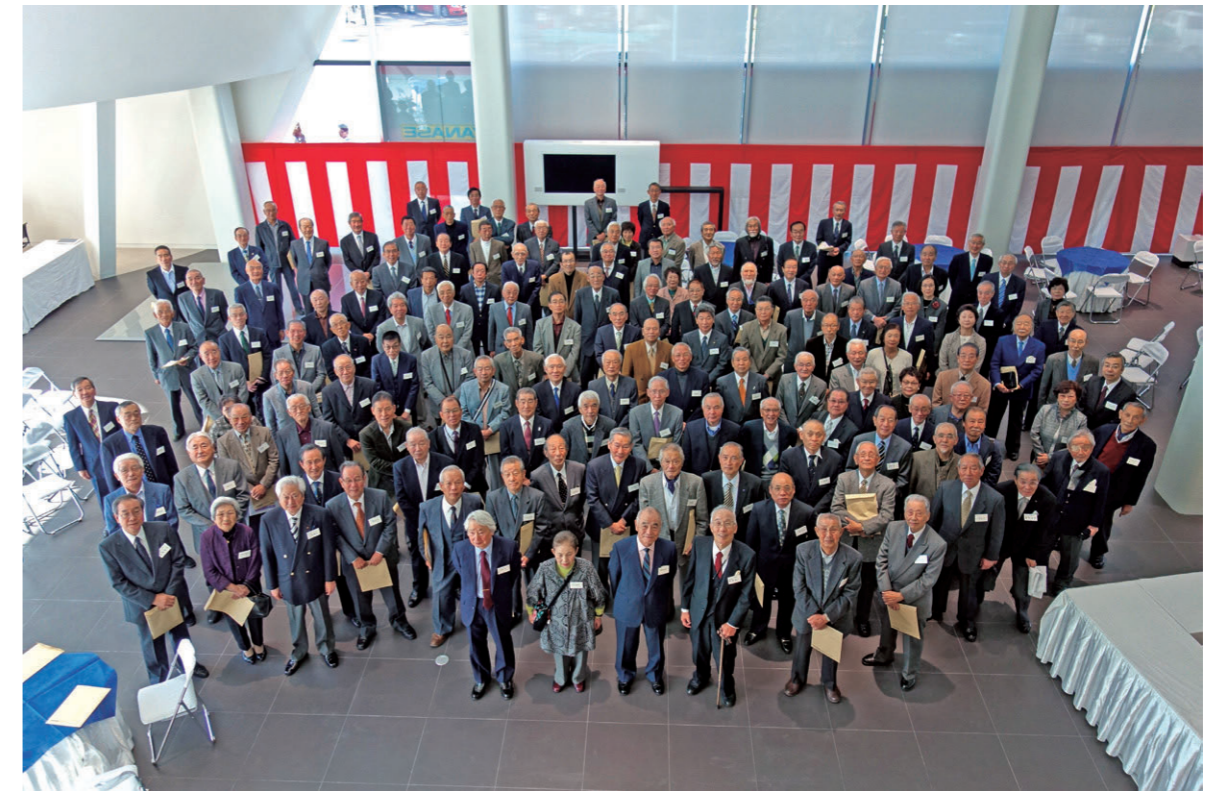
2012(平成24)年、轍会の芝浦新社屋見学会

これらのOB会を統合して1988(昭和63)年、退任役員、定年退職者、永年勤続後に退職された方々によるOB会「ヤナセ わだち 轍会」を発足させた。当初の会員は195名で、7月9日にヤナセビル新館6階会議室において発会式を執り行った。