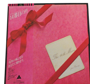
荒井由実のレコード