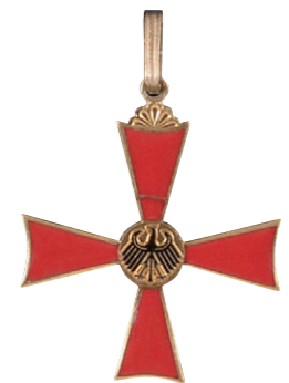
ドイツ連邦共和国功労勲章大功労十字章