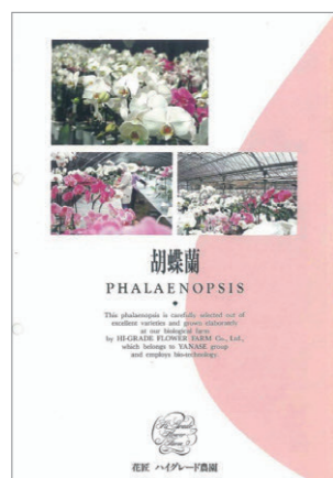
ハイグレード農園で胡蝶らの生産・卸売を開始