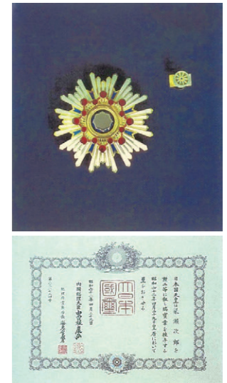
勲二等瑞宝章と勲記

このほか、1986（昭和61）年には、フランス政府から最高の芸術文化勲章である「COMMANDEUR DE