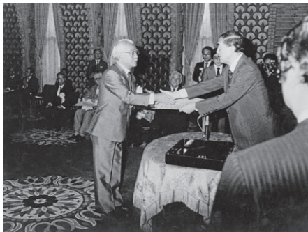
貿易表彰受賞

貿易摩擦を回避するためには、製品輸入の拡大が急務となっていたことから、当時の中曽根政権が輸出偏重から輸入重視に転換したのは前節で述べたとおりである。その政策に従って新設されたのが貿易表彰制度であった。