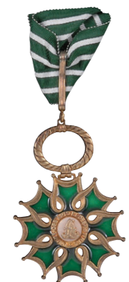
フランス共和国芸術文化勲章