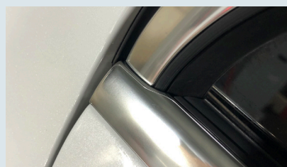
精度が高いフィルムカット形状