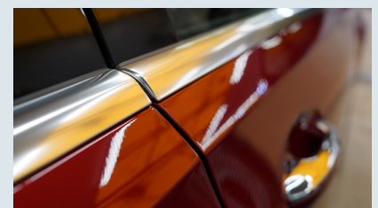
長期間光沢を維持する高い品質