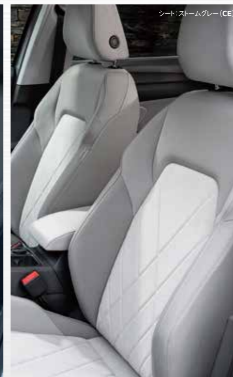
シート:ストームグレー (CE)