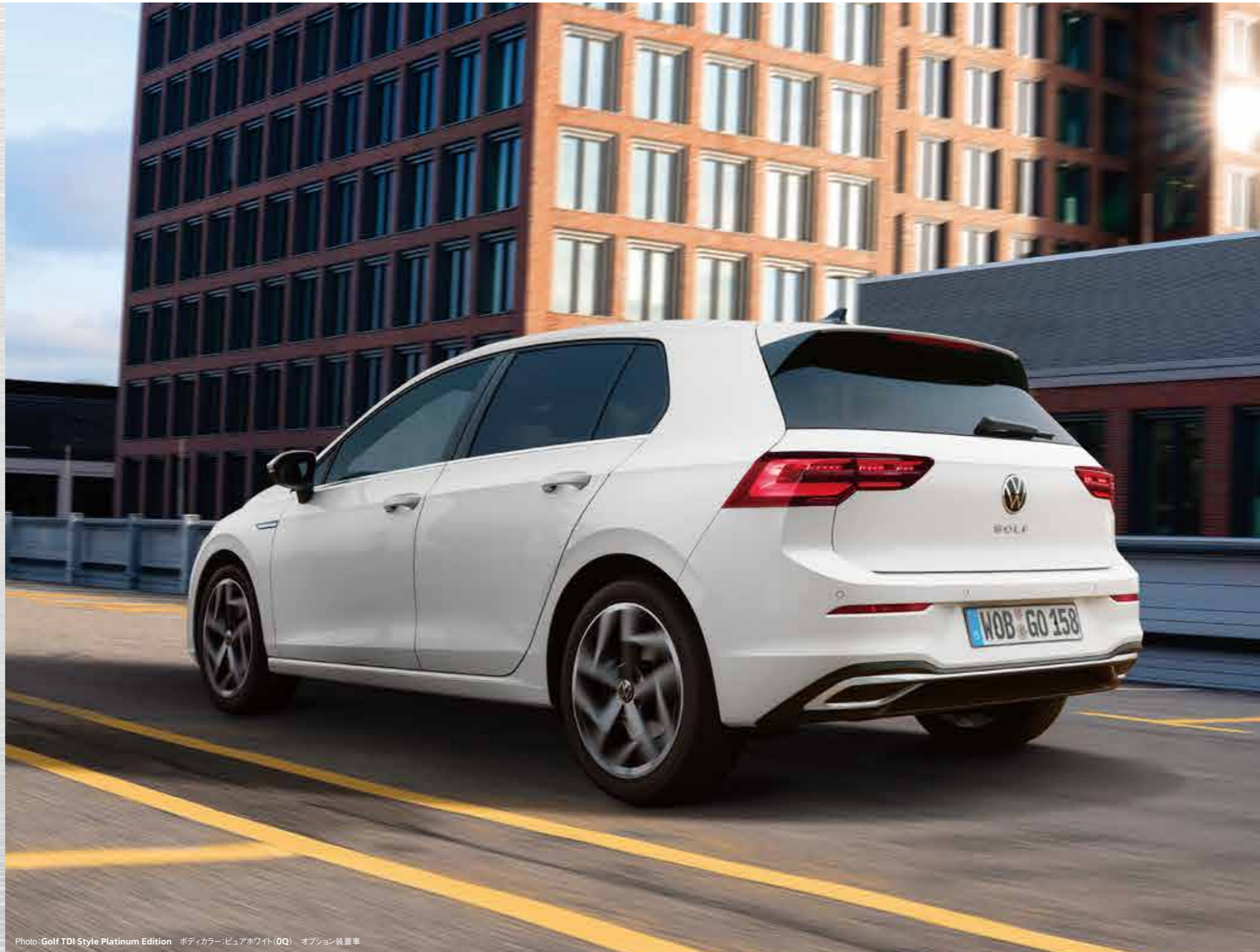
Photo: Golf TDI Style Platinum Edition ボディカラー:ビュアホワイト(OQ) オプション:装着車

高速コーナリング時に駆動輪内側のグリップ不足を検知すると、瞬時にブレーキをかけて内輪の空転を抑制。トラクションを回復させてアンダーステアを軽減します。