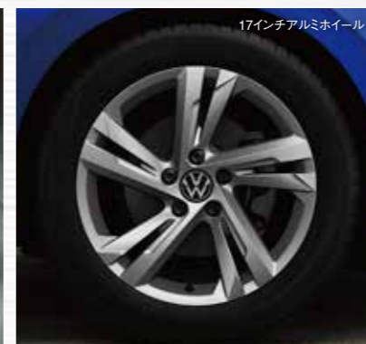
17インチアルミホイール