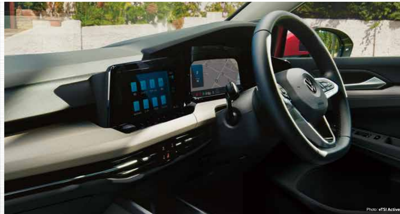
Photo: eTSI Active

ゴルフの魅力を身近に楽しめる eTSI Active / TDI Active Advance。 多彩な運転支援システムや デジタルテクノロジーを搭載し、 ゴルフの先進性を存分に味わえます。