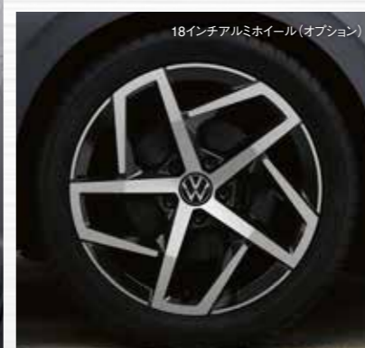
18インチアルミホイール (オプション)