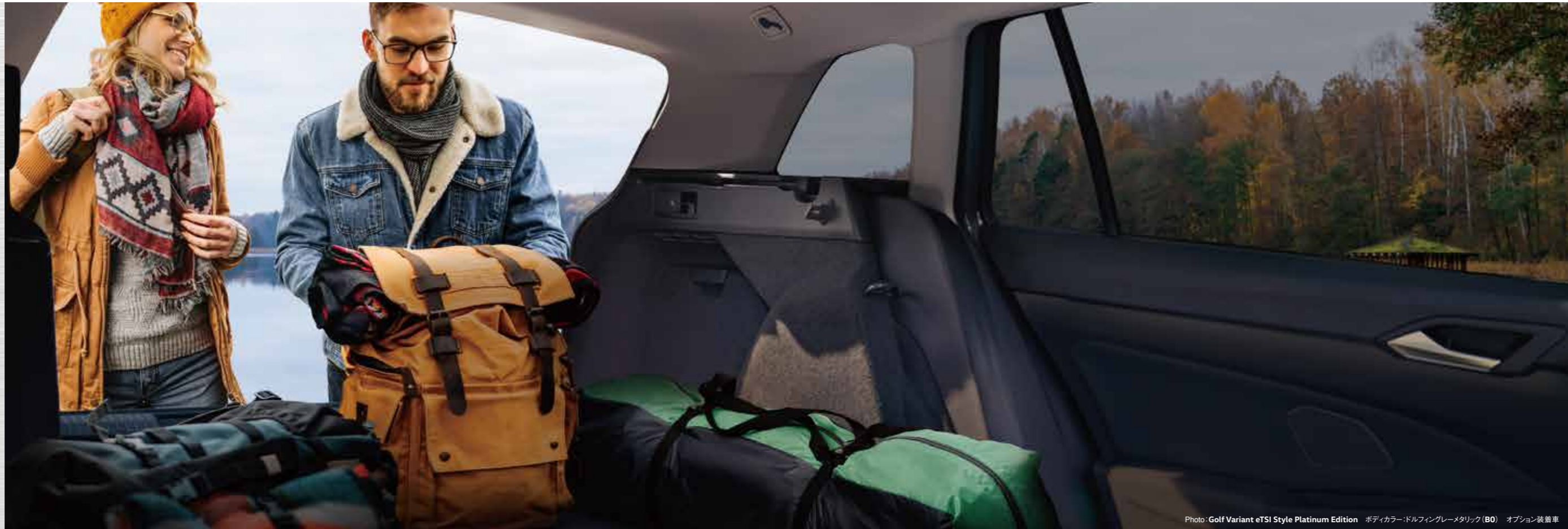
Photo: Golf Variant eTSI Style Platinum Edition ボディカラー:ドルフィングレーメタリック (B0) オプション装着車

取り回しの良いボディサイズでありながら、 大容量のラゲージスペースを実現。 たくさんの荷物や長い荷物も運べて、 低い開口部は積み降ろしもスムーズ。 さまざまなライフシーンでアクティブな 毎日の楽しみ方や新しいアイデアが、 自由自在に広がっていきます。