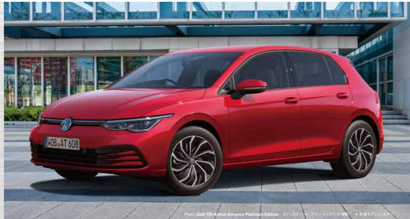
Photo: Golf TDI Active Advance Platinum Edition ボディカラー: キングスレッドメタリック (P8)* * 有償オプションカラー