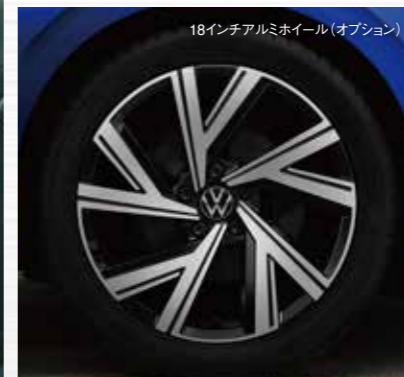
18インチアルミホイール(オプション)