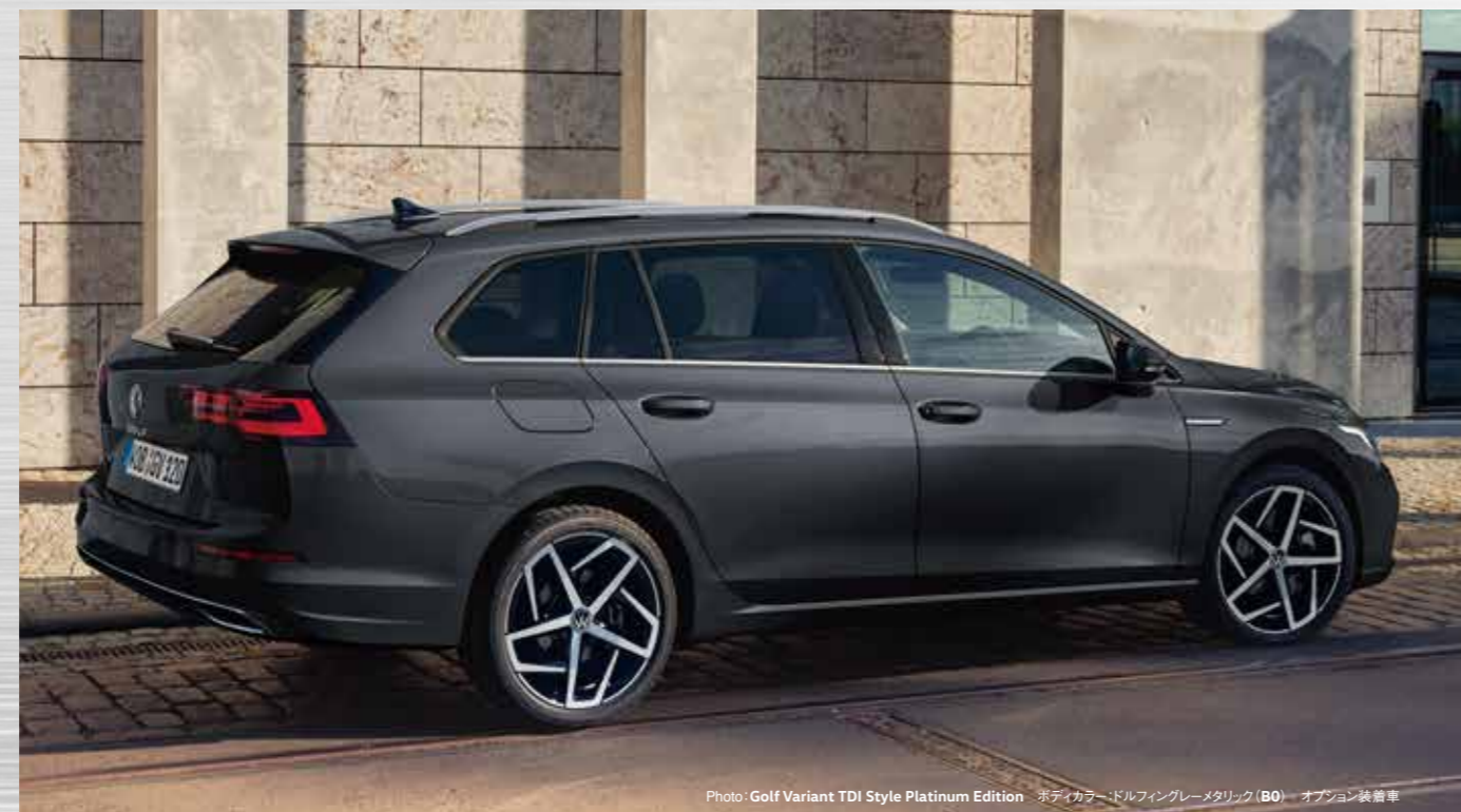
Photo: Golf Variant TDI Style Platinum Edition ボディカラー:ドルフィングレーメタリック (B0) オプション装着車

マイルドハイブリッドシステムや クリーンディーゼルによるスムーズかつ パワフルな走り、先進の運転支援・ 安全装備、そしてデジタルコックピットを 搭載したゴルフの魅力を楽しめる スタイリッシュで洗練されたモデルです。