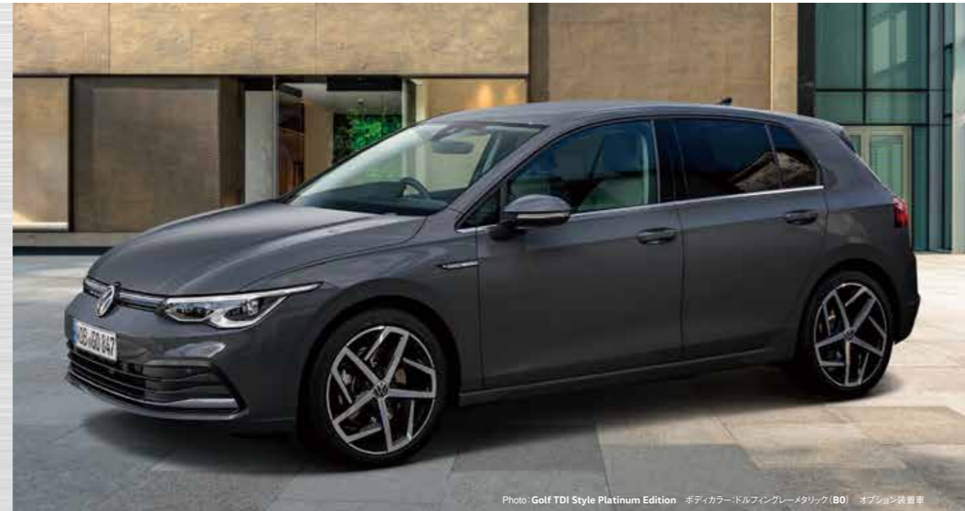
Photo: Golf TDI Style Platinum Edition ボディカラー:ドルフィングレーメタリック (B0) オプション装着車