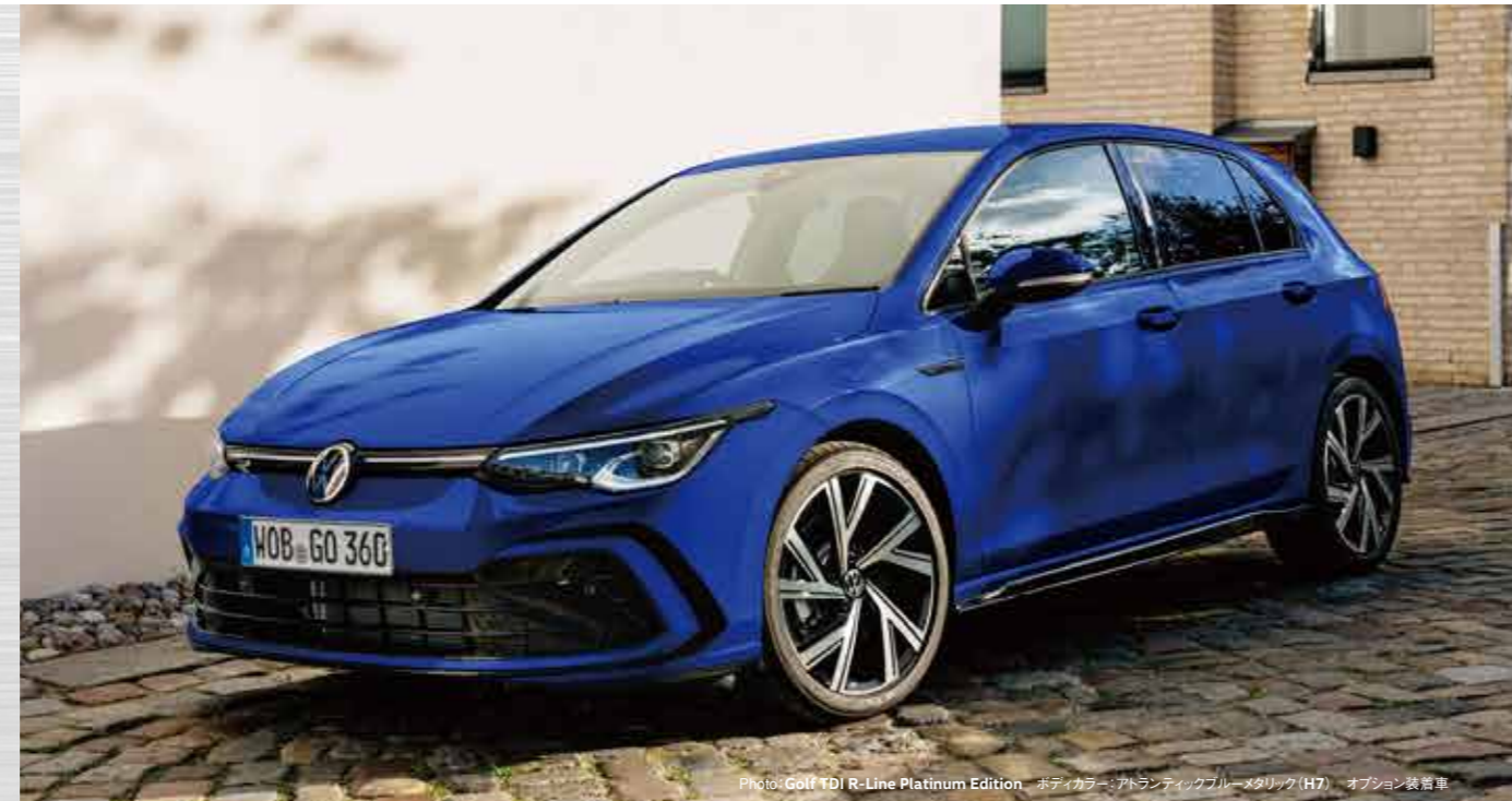
Photo: Golf TDI R-Line Platinum Edition ボディカラー:アトランティックブルーメタリック(H7) オプション装着車