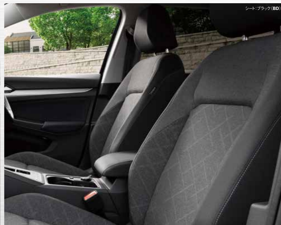
シート: ブラック (BD)