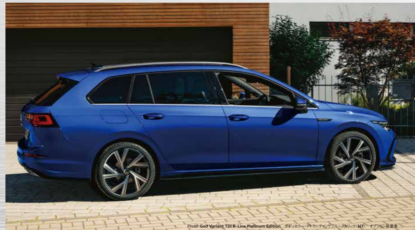
Photo: Golf Variant TDI R-Line Platinum Edition ボディカラー:アトランティックブルーメタリック(H7) オプション装着車

エクステリアもインテリアもR-Line専用。 足回りも専用スポーツサスペンションを 装備するなど、スポーツマインドあふれる 専用装備を充実させたモデル。 eTSI®/TDI®エンジンの走りを、 ひとときわ精悍なスタイルで堪能できます。