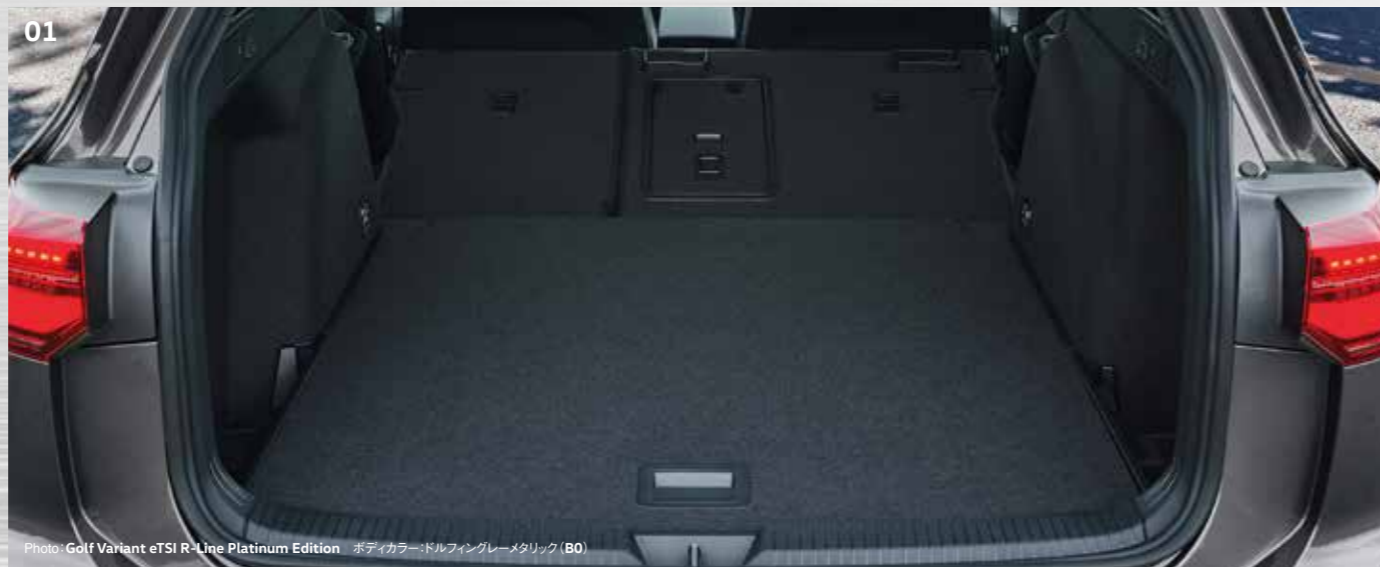
Photo: Golf Variant eTSI R-Line Platinum Edition ボディカラー:ドルフィングレーメタリック (B0)

* eTSI Active、TDI Active Advanceは10色から選択可能。