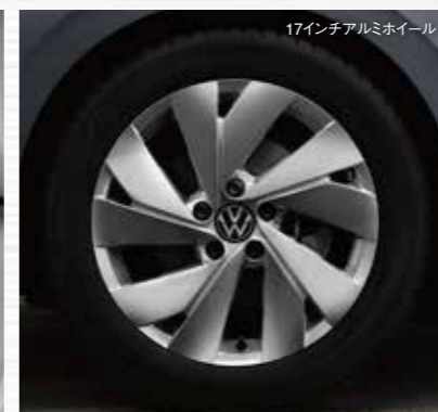
17インチアルミホイール