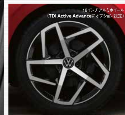
18インチアルミホイール (TDI Active Advanceにオプション設定)