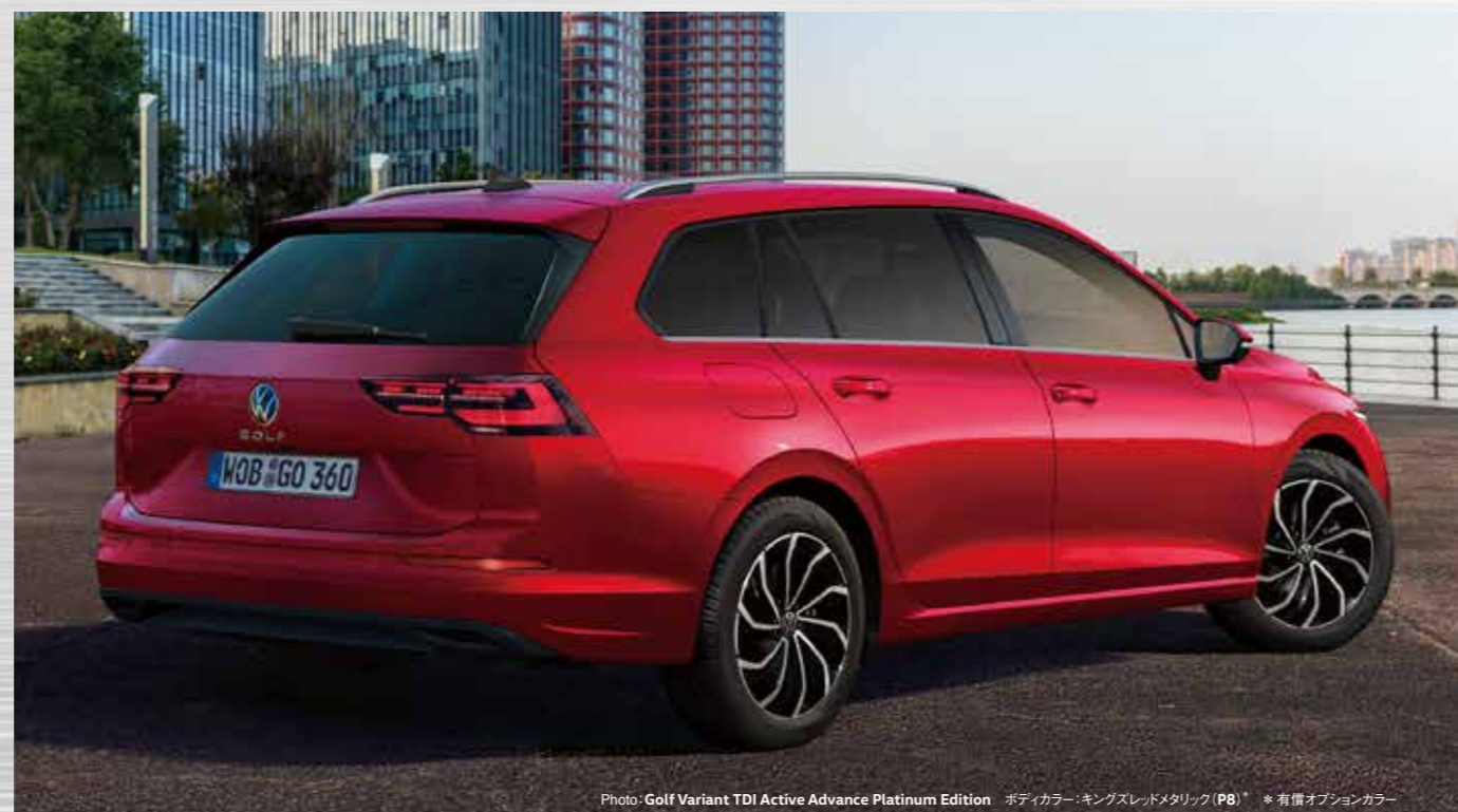
Photo: Golf Variant TDI Active Advance Platinum Edition ボディカラー: キングスレッドメタリック (P8)* * 有償オプションカラー

ゴルフの魅力を身近に楽しめる eTSI Active / TDI Active Advance。 多彩な運転支援システムや デジタルテクノロジーを搭載し、 ゴルフの先進性を存分に味わえます。