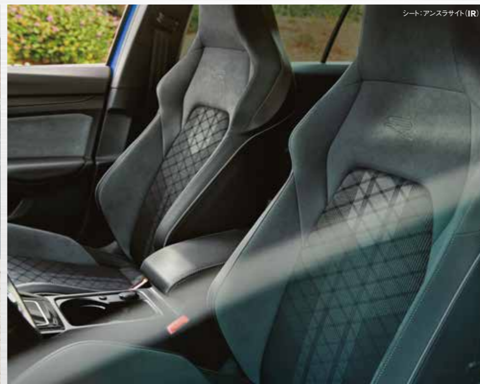
シート:アンスラサイト(IR)