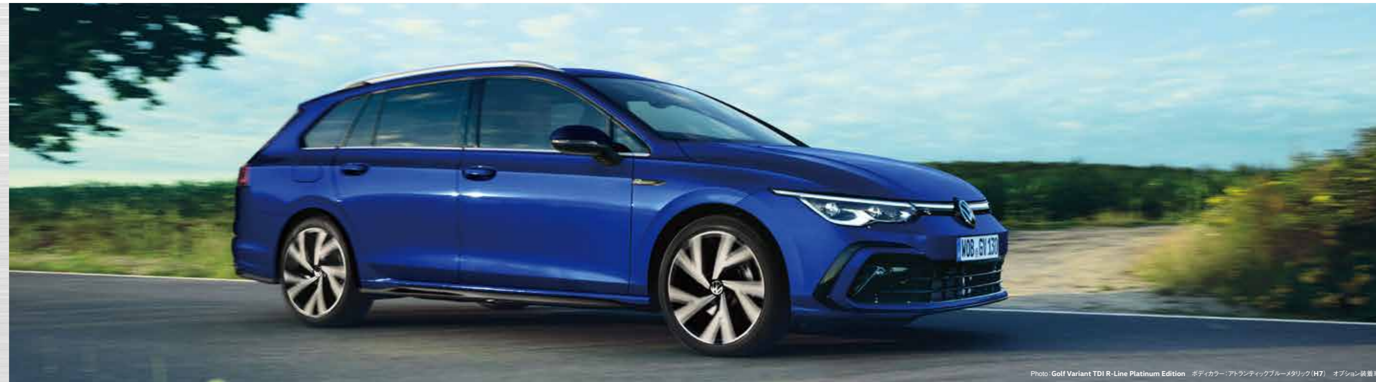
Photo: Golf Variant TDI R-Line Platinum Edition ボディカラー:アトランティックブルーメタリック(H7) オプション装着車

「ゴルフ/ゴルフ ヴァリアント プラチナム エディション」は、価値ある先進のテクノロジーを標準装備。そして、ロングドライブに適したトルクフル&低燃費な走りのフォルクスワーゲン史上最もクリーンなディーゼル、TDI®エンジン。燃費も良く気軽な街乗りにも最適な1.0ℓと荷物が多くても余裕のパワーで普段使いしやすい1.5ℓの2つのマイルドハイブリッド、eTSI®エンジン。高効率・経済性・力強い走りと環境対策を高次元で両立したゴルフは、ライフスタイルに合わせハッチバックとヴァリアントからお選びいただけます。