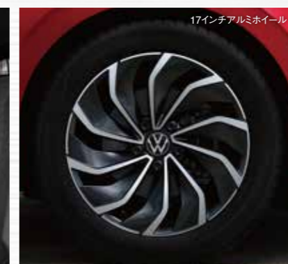
17インチアルミホイール