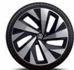
20インチアルミホイール