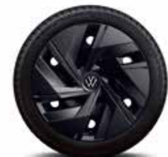
18インチスチールホイール

*1 “Ready 2 Discover MAX” および “Ready 2 Discover” はナビゲーション機能を提供していません。 *2 著作権保護されているWMA (Windows Media®Audio) 形式の音楽ファイルは再生できません。 *3 Bluetooth ® は米国Bluetooth SIG, Inc.の商標または登録商標です。Bluetooth ® は携帯電話の仕様や設定により、接続できない場合や、操作方法・表示・動作が異なる場合があります。 *4 ワイヤレス充電規格「Qi(チー)」に対応したスマートフォンなどが対象になります。