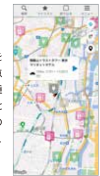
画面はイメージです。