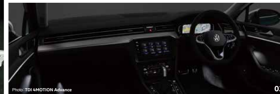
Photo: TDI 4MOTION Advance

*: ラゲージスペースの容量はVDA (ドイツ自動車工業会)方式による。( )内は後席を倒した場合。