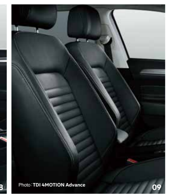
Photo: TDI 4MOTION Advance