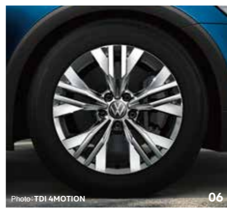
Photo: TDI 4MOTION