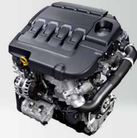
写真は機構説明用につき 実際のものとは一部異なります。