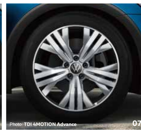
Photo: TDI 4MOTION Advance