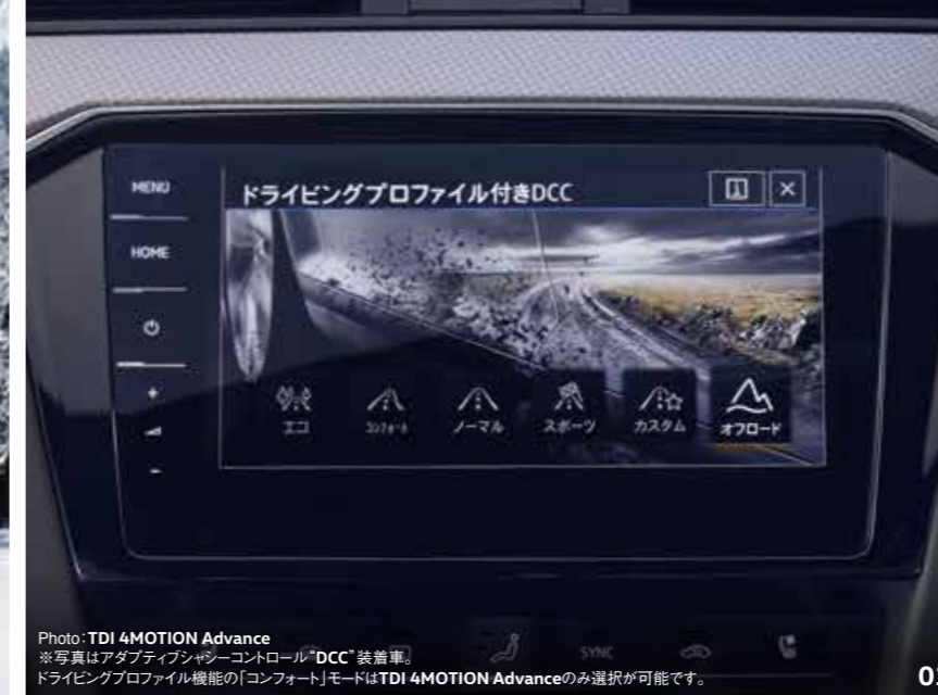
Photo: TDI 4MOTION Advance ※写真はアダプティブシャシーコントロール「DCC」装着車。 ドライビングプロフィール機能の「オフロード」モードはTDI 4MOTION Advanceのみ選択が可能です。