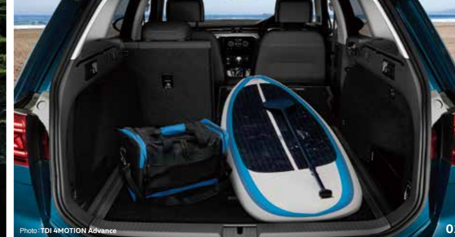
Photo: TDI 4MOTION Advance

Photo: TDI 4MOTION Advance アクセサリー装着車 一部日本未導入のアクセサリも含まれます。