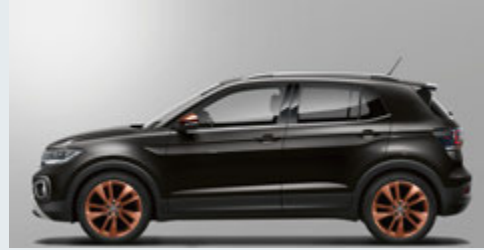
Deep Black Pearl Effect ディープブラックパールエフェクト(2T)