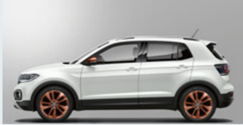
Pure White ピュアホワイト(0Q)