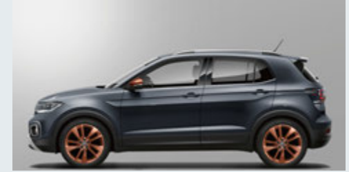
Smoky Grey Metallic スモーキーグレーメタリック(5W)