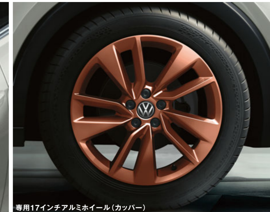
専用17インチアルミホイール(銅パー)