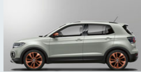
Ascot Grey アスコットグレー(6U)