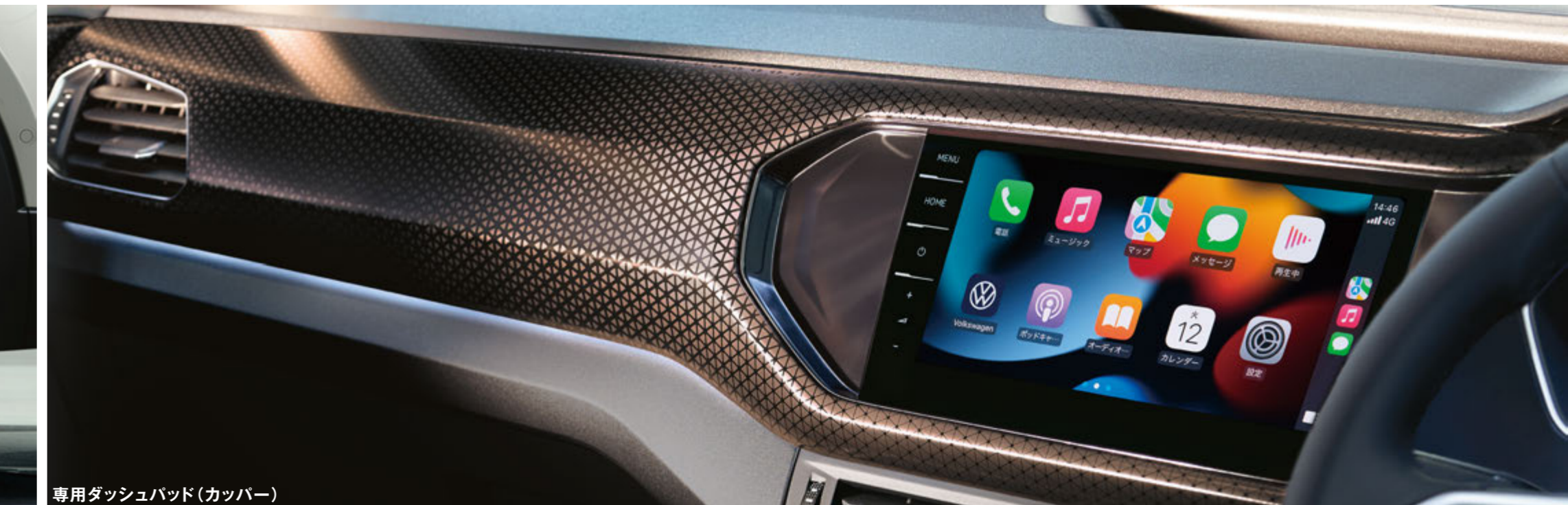
専用ダッシュボード(銅パー)