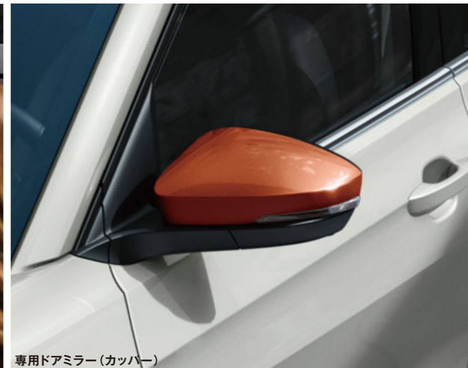
専用ドアミラー(銅パー)