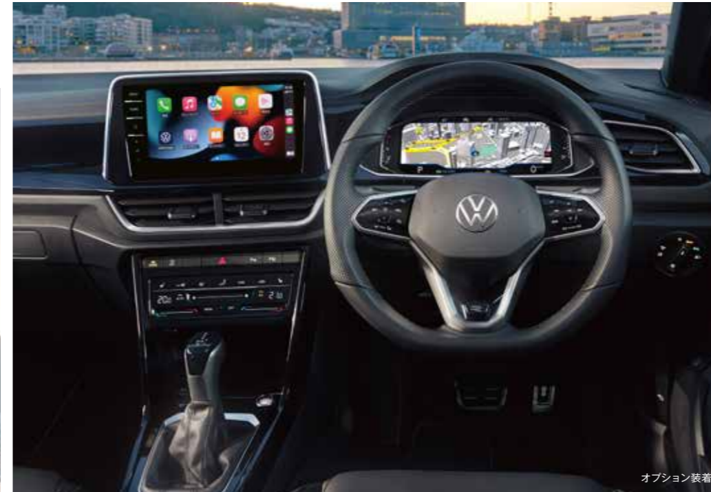
オプション装着車