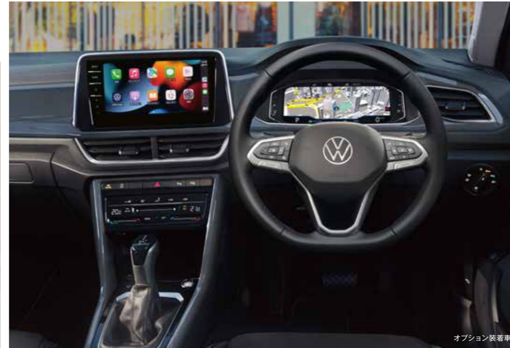
オプション装着車