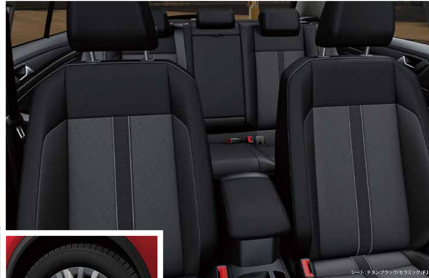
シート：チタンブラック/セラミック (FJ)