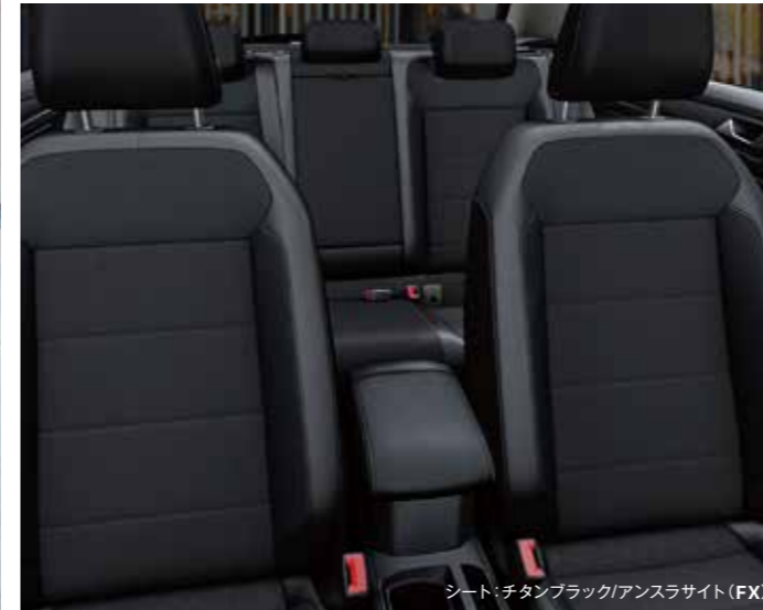
シート：チタンブラックアンスラサイト(FX)