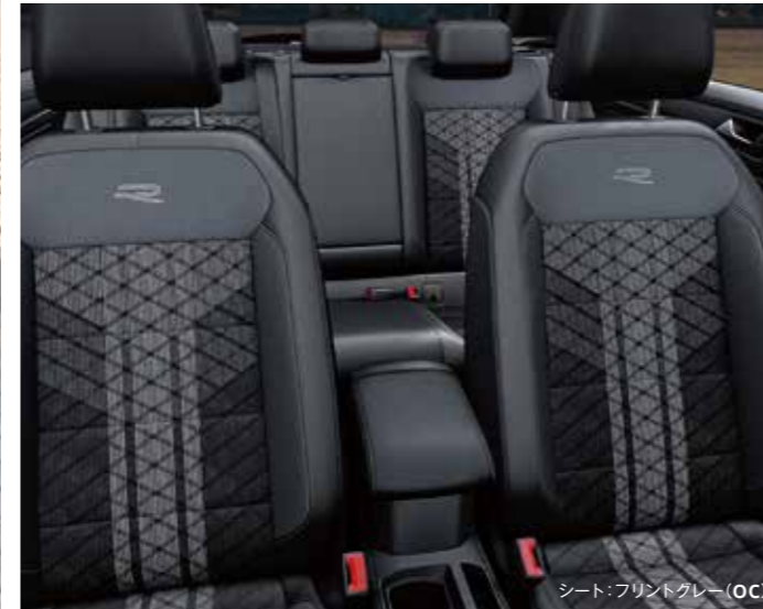
シート: フリントグレー (OC)