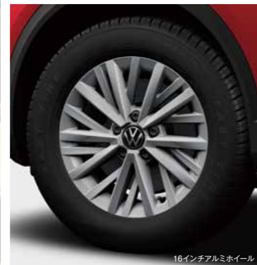
16インチアルミホイール