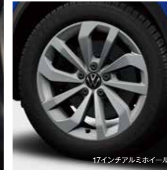
17インチアルミホイール