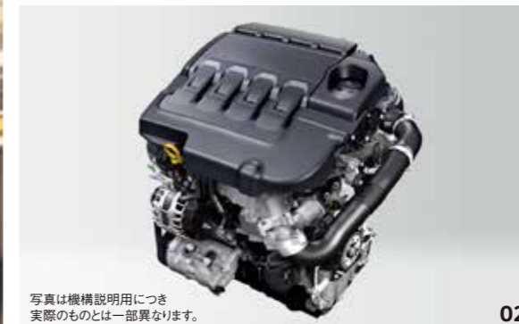
写真は機構説明用につき 実際のものとは一部異なります。