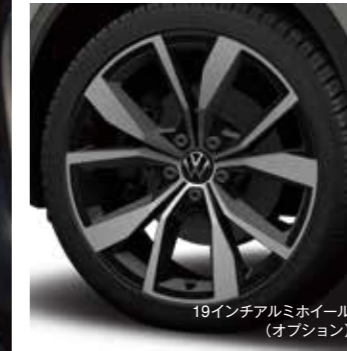
19インチアルミホイール (オプション)