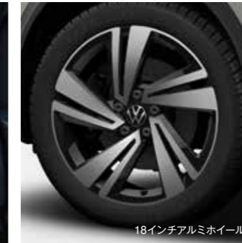
18インチアルミホイール