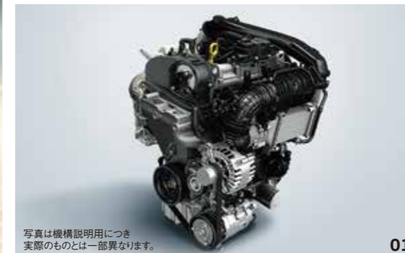
写真は機構説明用につき 実際のものとは一部異なります。

見た目の期待を裏切らない、ダイナミックで爽快なパフォーマンス。T-Rocは力強い1.5ℓ TSI®エンジンと、ロングドライブも得意なクリーンディーゼルの2.0ℓ TDI®エンジンをラインアップ。7速DSG®などのテクノロジーと相まって、気持ちのいい加速やクルマとひとつになる高速安定性を楽しめます。