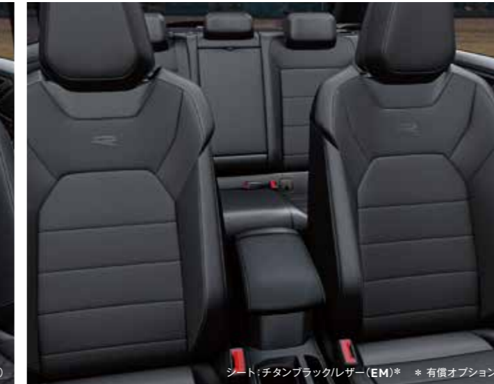
シート: チタンブラックレザー (EM)* * 有償オプション