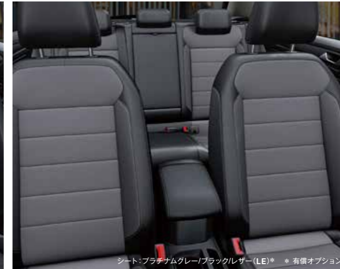
シート：プラチナムグレーブラックレザー(LE)* * 有償オプション