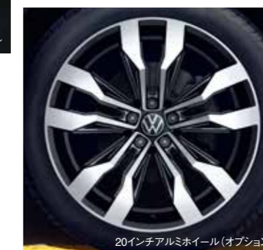
20インチアルミホイール (オプション)