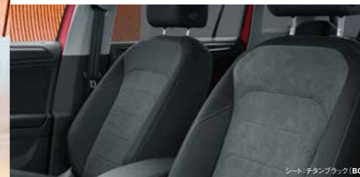
シート: チタンブラック (BG)