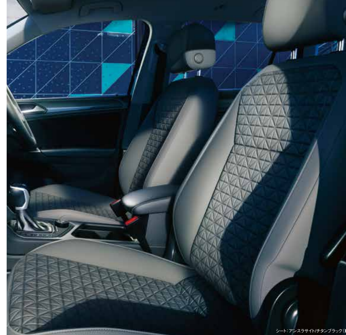
シート: アンスラサイト/チタンブラック (HJ)