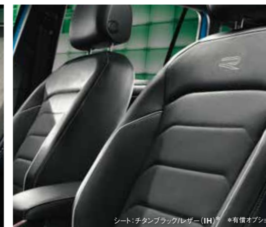
シート: チタンブラック/レザー (IH) ※有償オプション