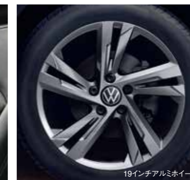
19インチアルミホイール