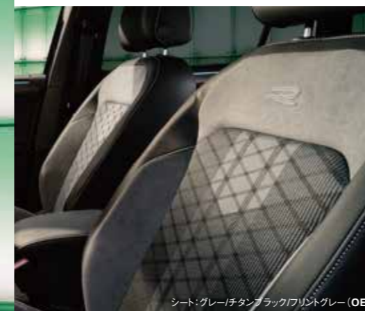
シート: グレー/チタンブラック/フロントグレー (OE)