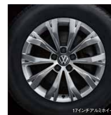
17インチアルミホイール