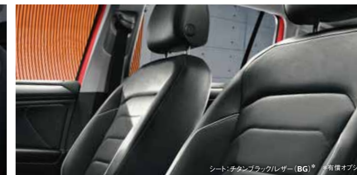
シート: チタンブラックレザー (BG)* *有償オプション

インフォテインメントシステム“Discover Pro”のナビ画面を 目の前のデジタルメーター内に表示できる“Digital Cockpit Pro”を装備。 さらに、走りに合わせて4つのモードから選べるドライビングプロファイル機能も搭載。 先進装備の数々を搭載して、ドライブの楽しさや快適さを満喫できるモデルです。