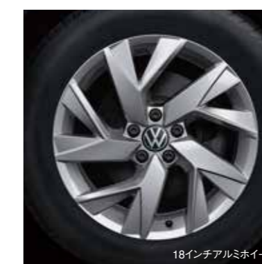
18インチアルミホイール

インフォテインメントシステム“Discover Pro”のナビ画面を 目の前のデジタルメーター内に表示できる“Digital Cockpit Pro”を装備。 さらに、走りに合わせて4つのモードから選べるドライビングプロファイル機能も搭載。 先進装備の数々を搭載して、ドライブの楽しさや快適さを満喫できるモデルです。