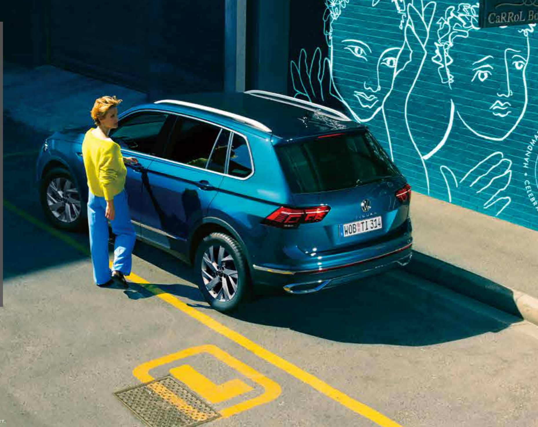
Photo: TSI Elegance ボディカラー: ナイトシェードブルーメタリック (V2) 写真は一部実際と異なる場合があります。

※これらのシステムは衝突などを自動で回避するものではありません。また、システムの制御には限界があり、道路状況や天候によっては作動しない場合があります。システムを過信せず、十分な注意を払い安全な運転を心がけてください。ご使用の際には必ず取扱説明書をお読みください。詳しくは正規ディーラーにお問い合わせください。