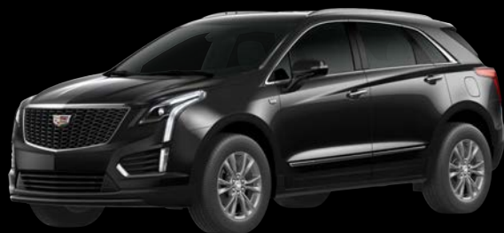
ステラーブラックメタリック *