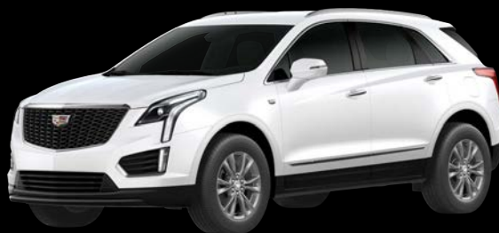
クリスタルホワイットトゥリコート *