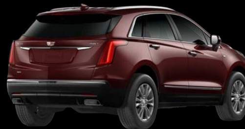
ローズウッドメタリック *