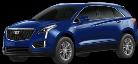
オブレントブルーメタリック