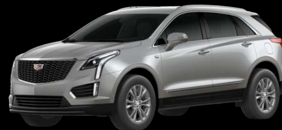
シャークスキンメタリック *