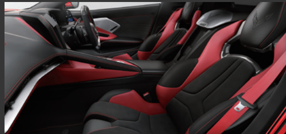
アドレナリンレッド / シートベルト：レッド 対応ボディカラー：2. に標準装備 1./4. に受注発注 3./5. は設定なし