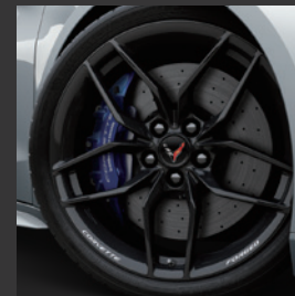
10-スポークグロスブラック 鍛造アルミホイール キャリパー：ブルー