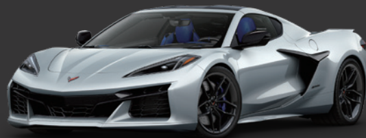
ブレードシルバー