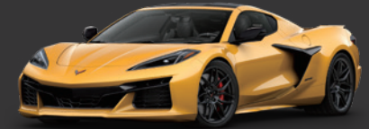
5. コンペティションイエロー