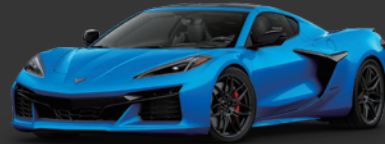
3. リップタイドブルー メタリック