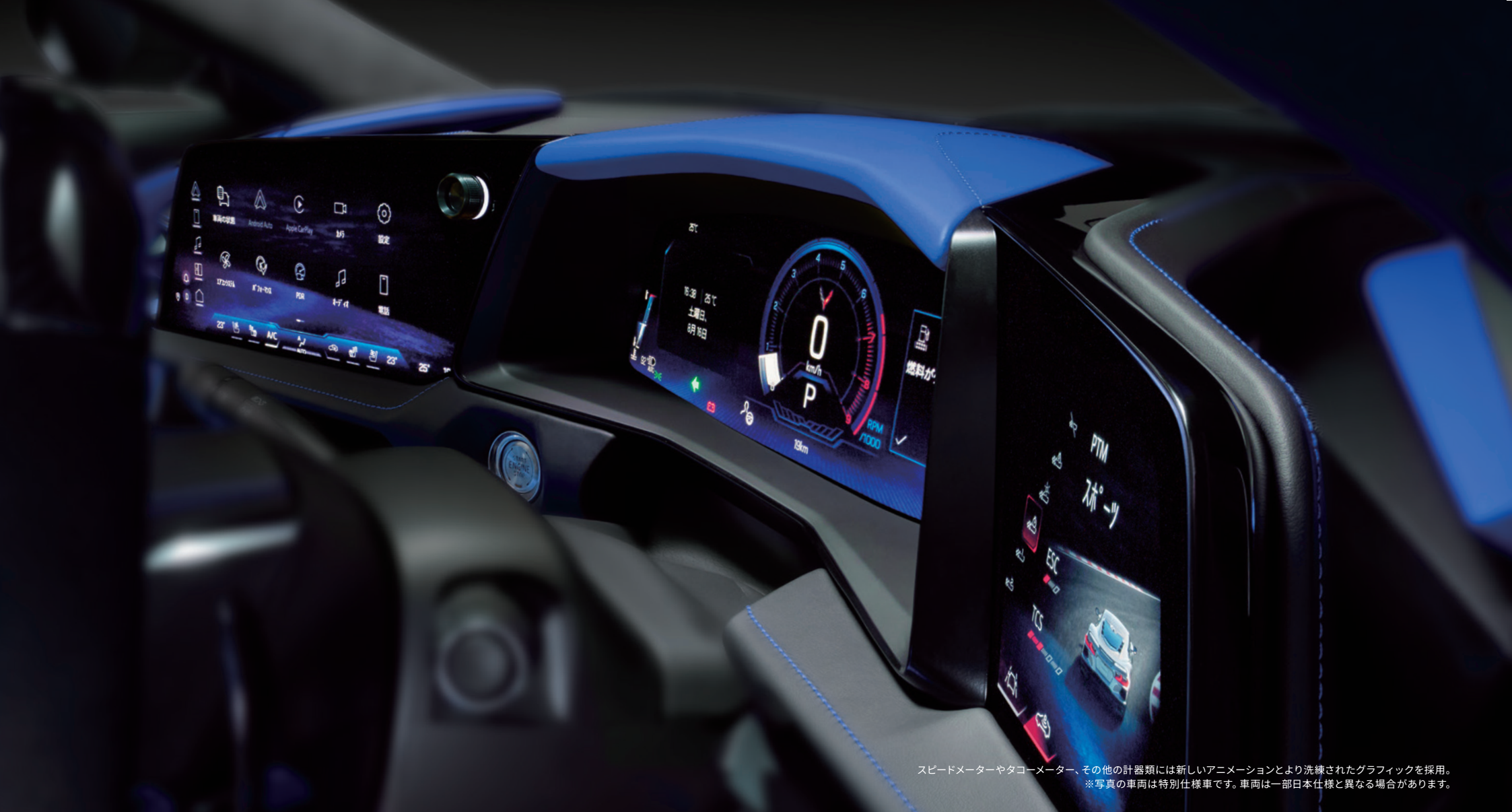
スピードメーターやタコメーター、その他の計器類には新しいアニメーションとより洗練されたグラフィックを採用。 ※写真の車両は特別仕様車です。車両は一部日本仕様と異なる場合があります。

が自動的に切り替わるよう設定することも可能です。「パフォーマンスアプリ」では、リアルタイムの馬力とトルクの流れを表示し、パワーフロープロットで挙動を可視化。システムの改善と大型スクリーンの採用により強化されたパフォーマンスデータレコーダー（PDR）は、車内でのデータをリアルタイムで分析し、すべての走行セッションを高画質で録画します。速度トレースや並列動画再生、走行データに基づいた自動「スピードヒント」を通じて、あなたの走りをデータで進化させます。加えて、新しい Z06 は Google Built-in™ を搭載したカスタムインフォテインメントシステムを