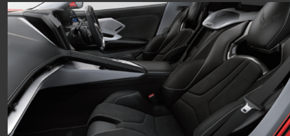
スカイクルグレー / シートベルト：ブラック 対応ボディカラー：3. に受注発注 1./2./4./5. は設定なし