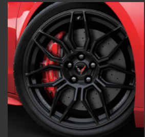
スパイダーデザイン ブラック 鍛造アルミホイール クーペ キャリパー：ブライトレッド コンバーチブル キャリパー：エッジレッド

※インテリアカラーは、クーペ/コンバーチブル共通となります。(クーペ：スウェーデッドマイクロファイバーインサート/コンバーチブル：パーフォレーテッドナバレザーインサート) ※「受注発注」については、生産の都合上早期に終了となる場合があります。詳しくは販売店にお問い合わせください。