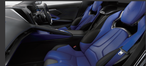
サントリーニ / シートベルト：ブルー

※写真の車両は一部日本仕様と異なる場合があります。日本仕様車は右ハンドルとなります。