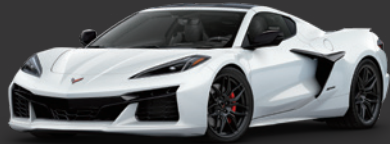
1. アークティックホワイト