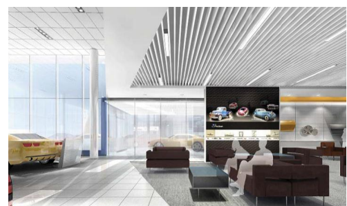
カスタマーラウンジイメージ