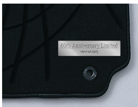
専用フロアマットイメージ