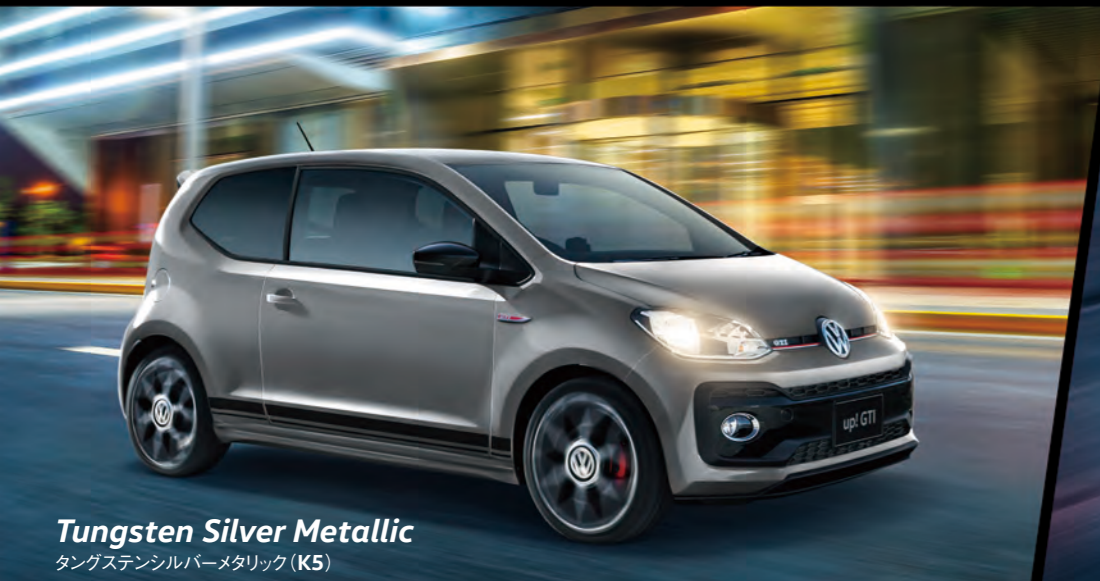
Tungsten Silver Metallic タングステンシルバーメタリック (K5)