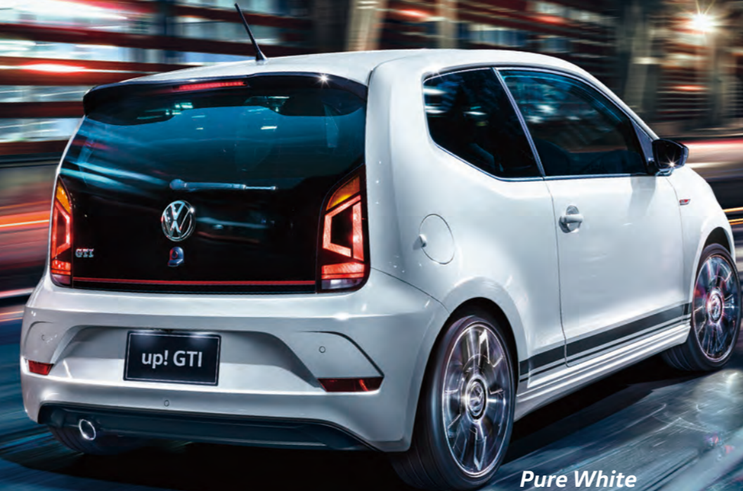
Pure White ビュアホワイト (0Q)

瞬く間にSOLD OUTとなったup! GTI。ご好評にお応えして、第二弾の登場です。プレミアムなサウンドが楽しめる“beats sound system”や、安全な駐車をサポートするリヤビューカメラなどを搭載し、さらに魅力がアップしました。2ドアのコンパクトなボディに、最高出力116PSを発生させる1.0ℓ TSI®エンジンと6速マニュアル。フロントグリルの伝統の赤いラインをはじめ、専用17インチアルミホイール/レッドブレーキキャリパー、タータンチェック柄のシートなど、ドライバーの心を惹きつけてやまない数々の装備。まさにGTIの思想を受け継ぎ進化した、初代GTIへのオマージュとなるモデルです。